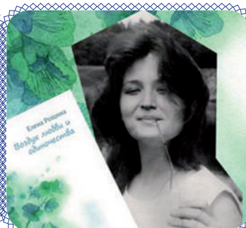
«Меня однажды вспомнят...» (стр. 10)