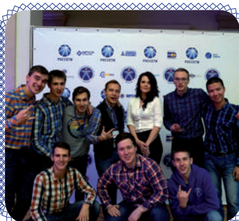
ССО «Ива»: победа возможна! (стр. 6)