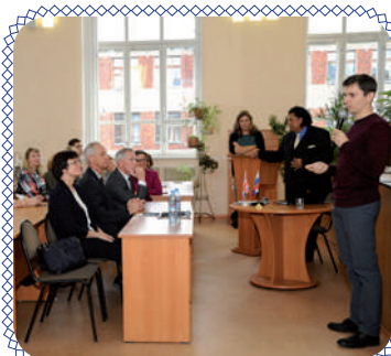
LSI: английский для целеустремленных (стр. 4 – 5)