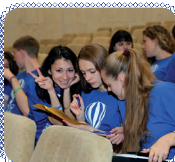
Школа позитива (стр. 9)